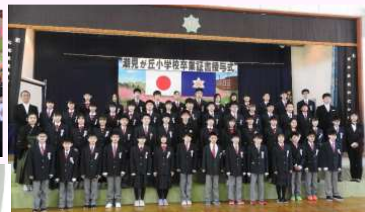
6年生の皆さん卒業おめでとう！